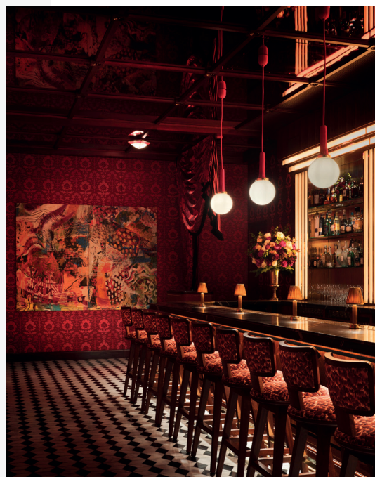
© Ken Fulk Inc / Major Food Group