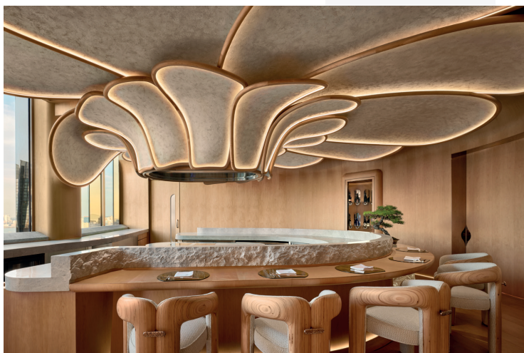
@ Henderson Land