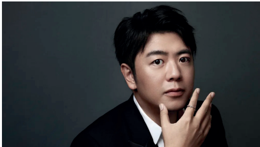
LANG LANG Pianiste (Chine)