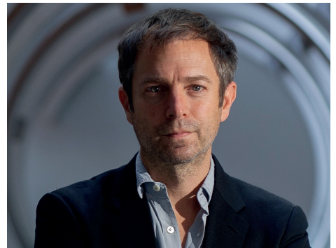
LEANDRO ERLICH Artiste conceptuel (Argentine)