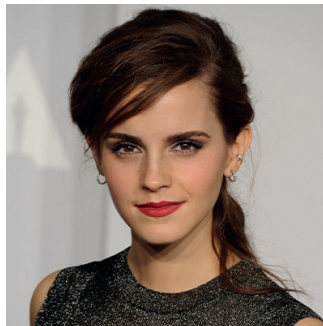
EMMA WATSON Actrice (Royaume-Uni)