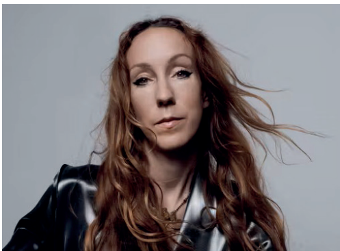
IRIS VAN HERPEN Styliste (Pays-Bas)