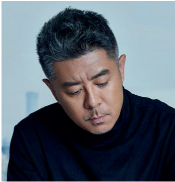
MA YANSONG Architecte (Chine)