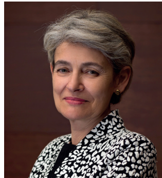
IRINA BOKOVA Ancienne Directrice générale de l'UNESCO Présidente du Jury mondial (Bulgarie)