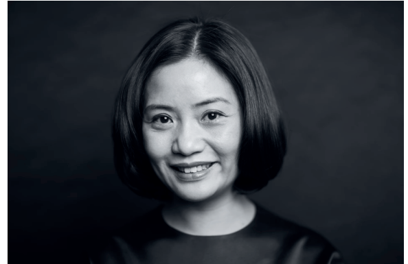
GUO PEI styliste (Chine)