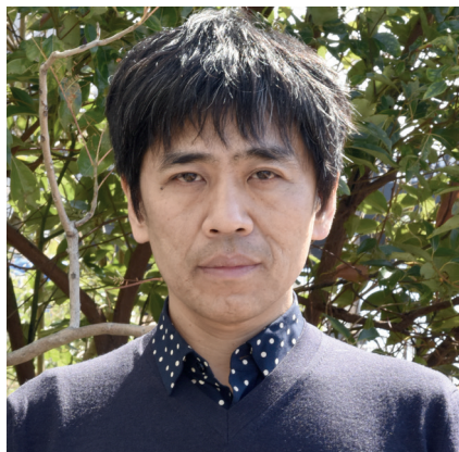
RYŪE NISHIZAWA architecte (Japon)