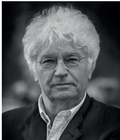
JEAN-JACQUES ANNAUD cinéaste, président du Jury mondial (France)