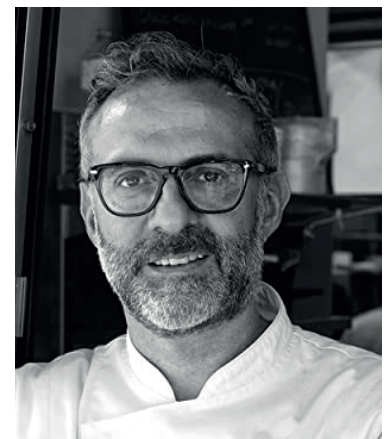
MASSIMO BOTTURA chef (Italie)