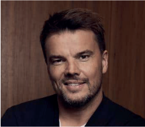
BJARKE INGELS architecte (Danemark)